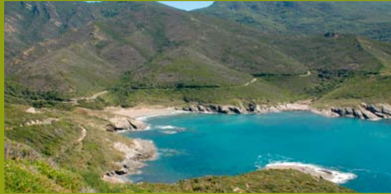
Einsame Buchten laden zum Baden ein, kein Kampf der Badetücher!