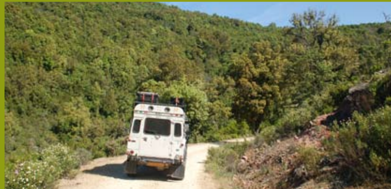
Offroad Track im Fango-Tal.

mitte auf dem kleinen, gemütlichen Campingplatz "Tizzarello". Für uns bisher der schönste in Korsika! Viele Steineichen bieten versteckte schattige Stellplätze, die sanitären Anlagen sind sehr gepflegt und nebenan rauscht der Asco, der mit mehreren kleinen Gumpen zum Baden einlädt. Und auch hier sammeln wir wieder einige Mückenstiche als Andenken für zu Hause ein.