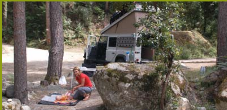
Camp im Restonica-Tal.