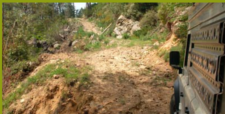
Auffahrt zum Schlafplatz im Wald am Mt. Renoso.

der hinab. Die Strecke bleibt extrem kurvig und abwechslungsreich. Wir durchfahren mehrere Wälder und erquicken uns am Anblick dieser unberührten und faszinierenden Natur. Erschöpft von den nicht enden wollenden Kurvenfahrten entscheiden wir uns kurzerhand, heute wieder einmal wild zu campen. Der nächste Waldweg ohne Sperrschild ist unserer! Wir biegen ab und fahren einige Kilometer durch idyllische und zerklüftete Landschaft. Außer ein paar Kühen, die genüsslich an den Kräutern zupfen, treffen wir niemand. Nach einer halben Stunde finden wir in einem toten Waldweg ein gemütliches Plätzchen auf 1150 Meter Höhe. Hier haben wir einen großartigen Ausblick auf das unter uns liegende Tal und auf die gegenüberliegenden noch immer schneebedeckten Gipfel. In der Ferne plätschert ein kleiner Bergbach sanft vor sich hin.