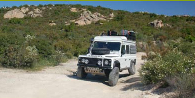
Auf der Rumpelpiste in der Dessert des Agriates darf der Landy mal verschränken.