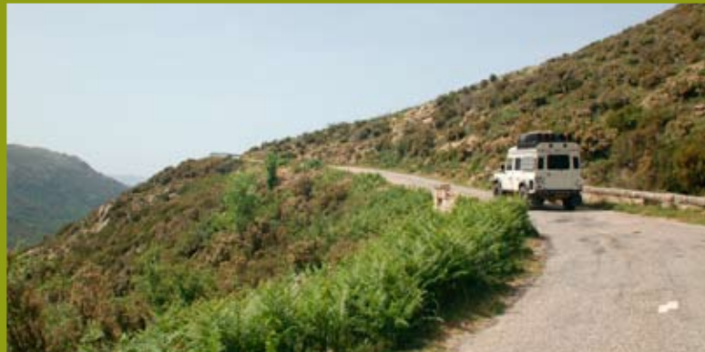
Eine der vielen, einsamen Gebirgsstraßen im Inland.