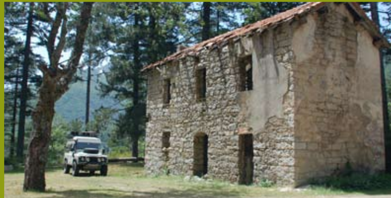
Verlassene Häuser finden sich immer wieder in den Bergen Korsikas ...

10 km in Monte-Estremo. Hier gibt es die sehr schöne Gite d'étape – Restaurant A FUNTANA am Ende des Dorfes an einem Steilhang gelegen. Von der Terrasse hat man einen tollen Panoramablick über das Fango-Tal. Der Wirt spricht deutsch und hat viele Tipps und Infos über die Umgebung und nennt uns auch einen schönen Offroad-Track! Wir genießen den Ausblick von der Terrasse und lassen uns ein köstliches Menü schmecken. Wieder einmal stellen wir fest, dass die Korsen die Gemütlichkeit erfunden haben müssen.