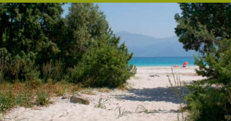
Weißer Sand und türkisfarbenes Wasser am Plage de Loto.