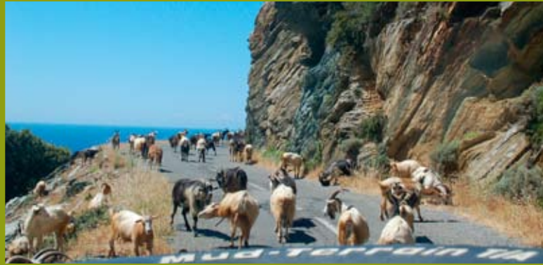
Achtung Wildwechsel, ein Stau der tierischen Art.