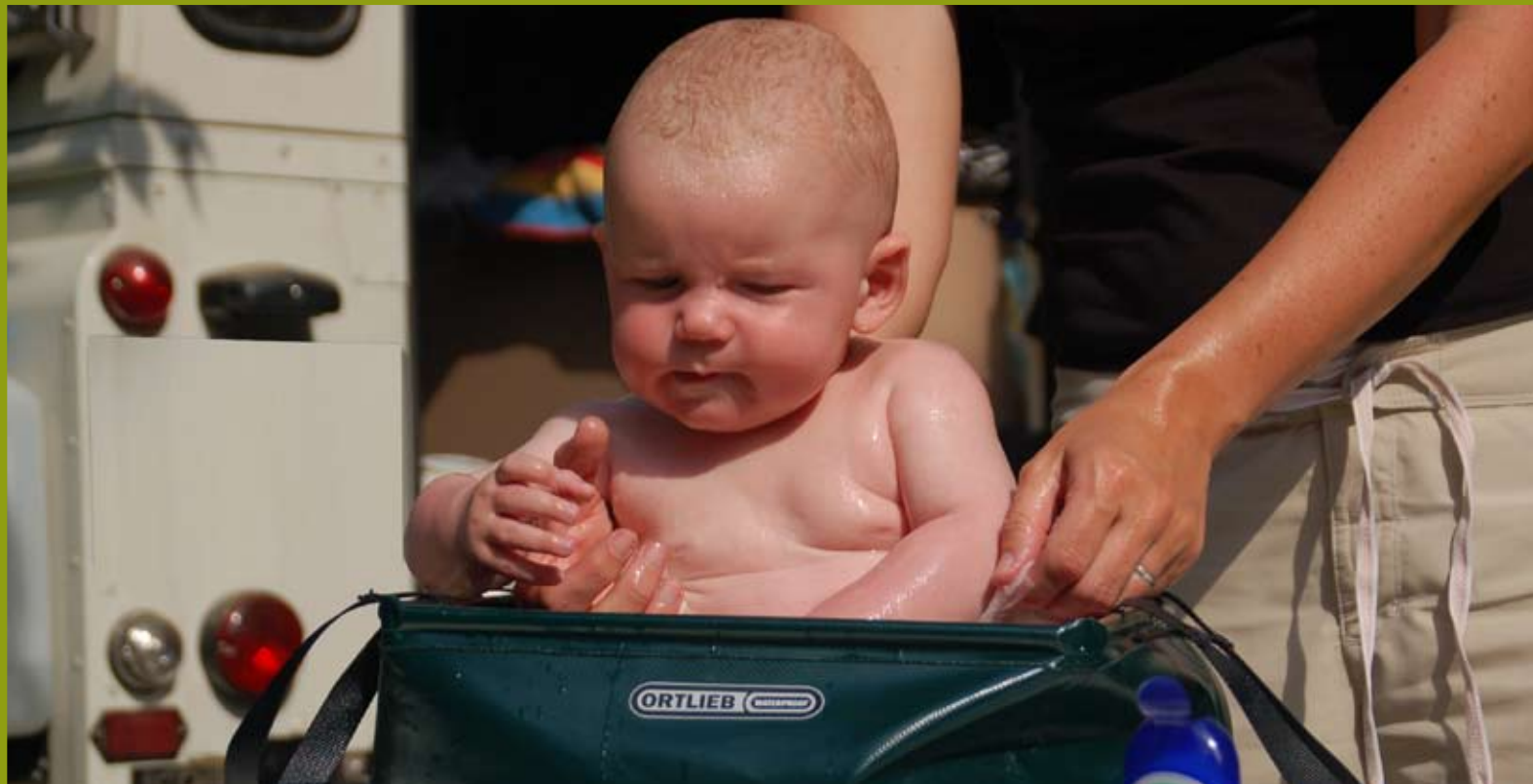
Heute ist Waschtag!

zu bekommen. Schade! Wir tätigen noch einige Einkäufe und verlassen die Stadt in nördlicher Richtung, um später westlich ins Golo-Tal abzubiegen. Die Straße schlängelt sich entlang dem Golo-Fluss durch die tief zerklüftete Schlucht hinauf bis zum Stausee Calacuccia. Eine eindrucksvolle, wilde Gebirgslandschaft begleitet uns. Der Stausee liegt eingebettet im weiten Talkessel umgeben von den höchsten Gipfeln Korsikas.