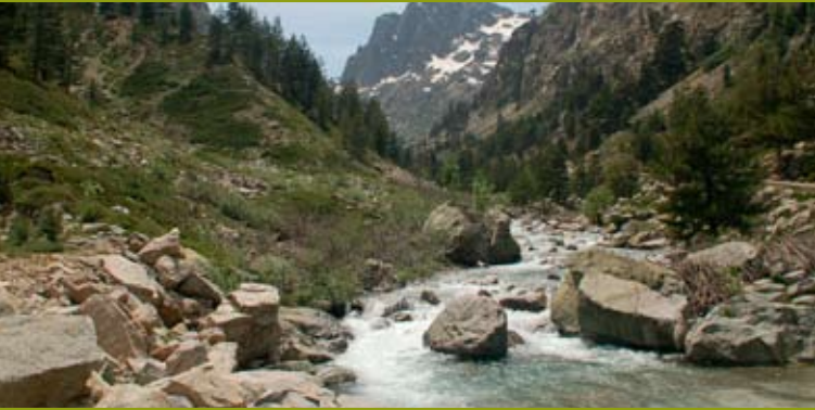
Wildes, schönes Land im Restonica-Tal.