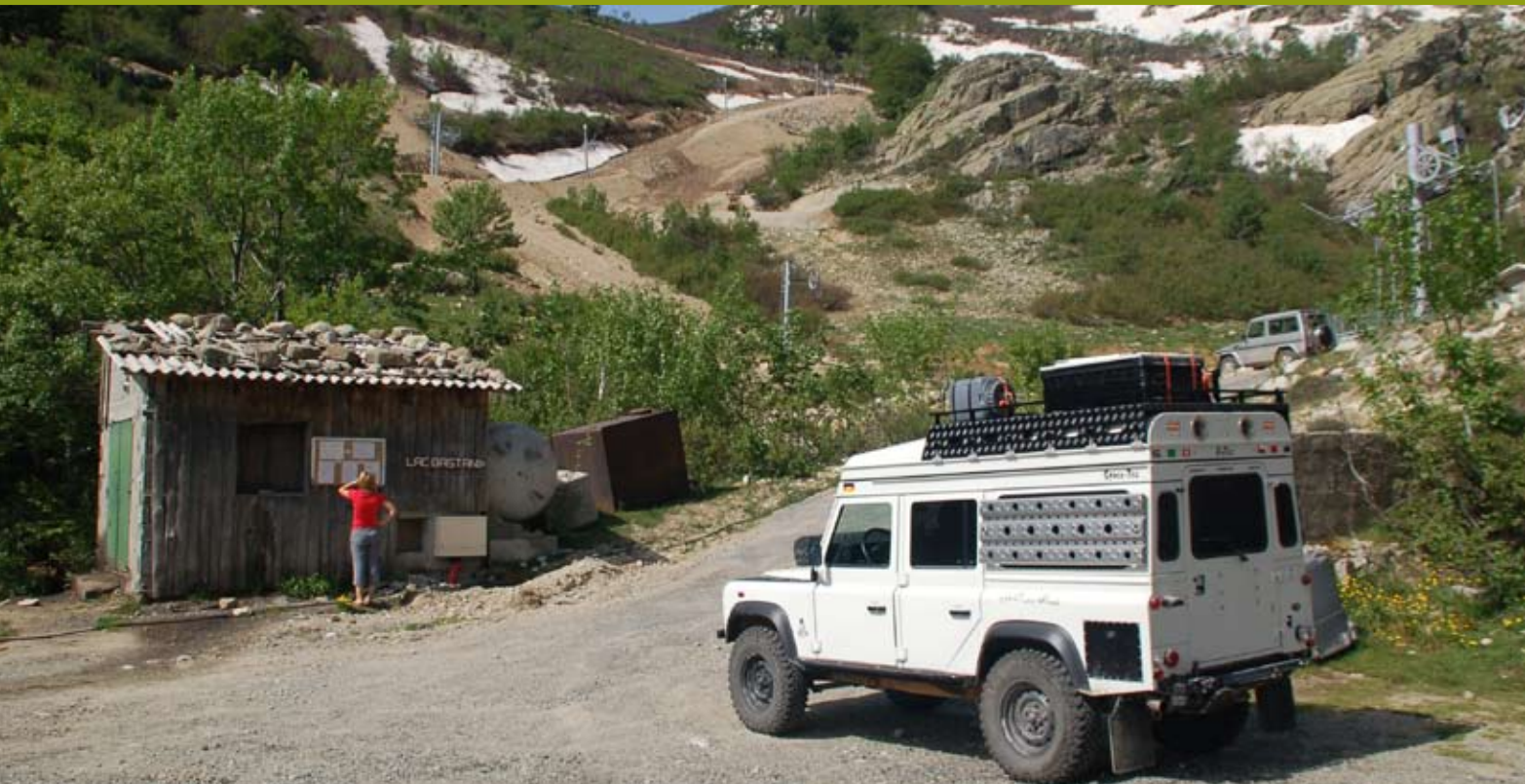
Vom höchstgelegenen Skigebiet Korsikas auf 1640 Meter Höhe genießen wir tolle Aussichten.

W ir schlängeln uns durch die kleine, nette Stadt in Richtung St-Florent. Bereits in Bastia steigt die Straße steil an und wird später immer enger und kurvenreicher. In St-Florent folgen wir der D81 westlich in Richtung L'Île-Rousse. Unser Ziel ist die "Desert des Agriates". Ein kleines braunes Holzschild "Plage de Saleccia" zeigt uns ca. 10km nach St-Florent den Weg in die Desert des Agriates zum Strand von Saleccia und zum Campingplatz Paradiso.