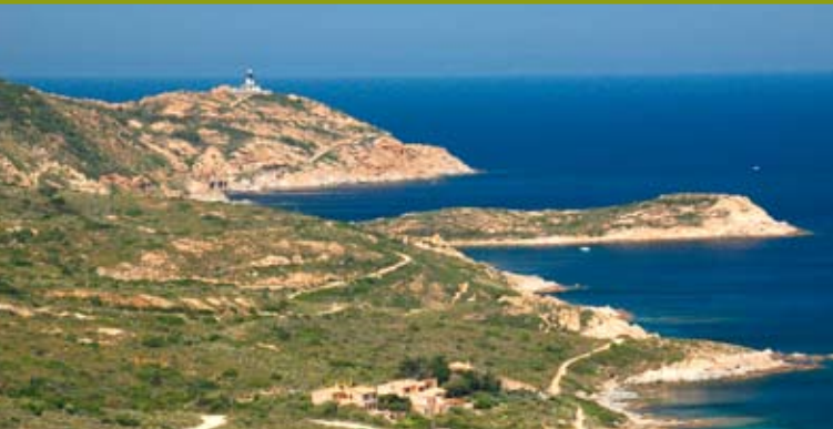
Die Westküste ist steil und zerklüftet.