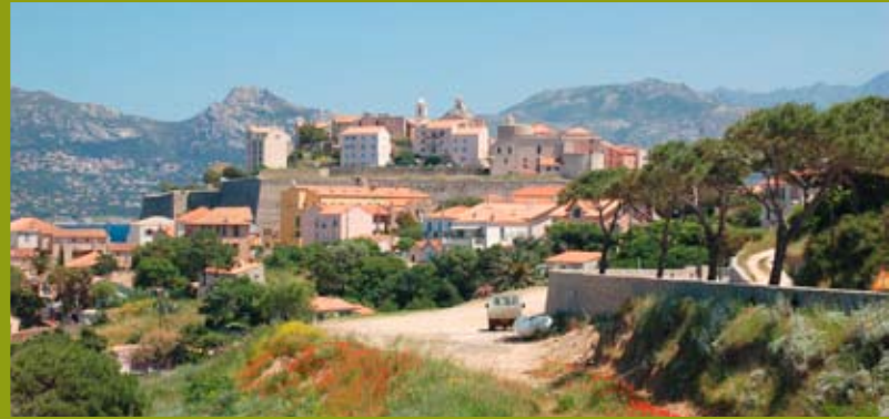
Malerischer Ort auf der 40 Kilometer langen Halbinsel Cap Corse.